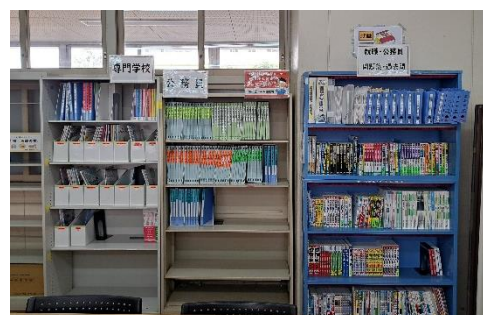
大学・短大・看護医療・専門・公務員・就職の各分野に対応