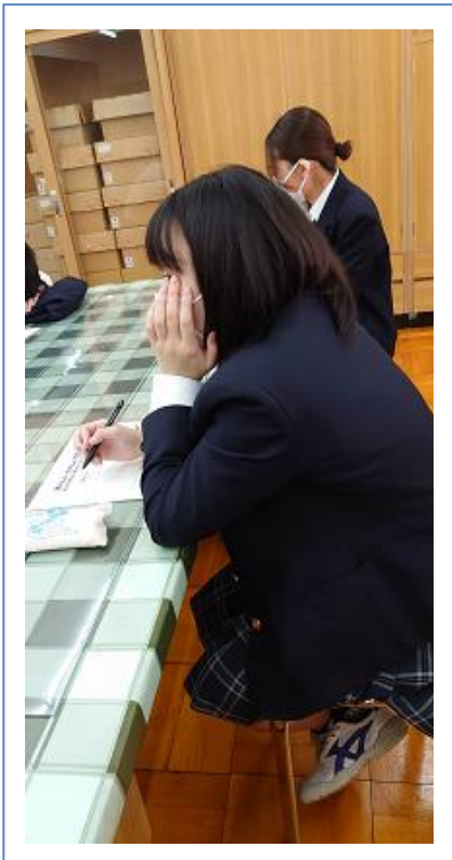
☞「赤ちゃんを産むってなると、自分が思っていたより考えることがいっぱいある」