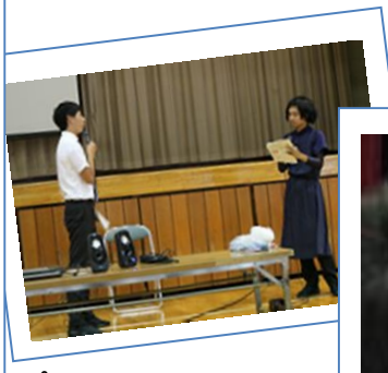
👂寸劇はインパクトMAX