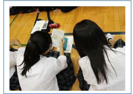
👂手元の資料を見ながら受講しました。